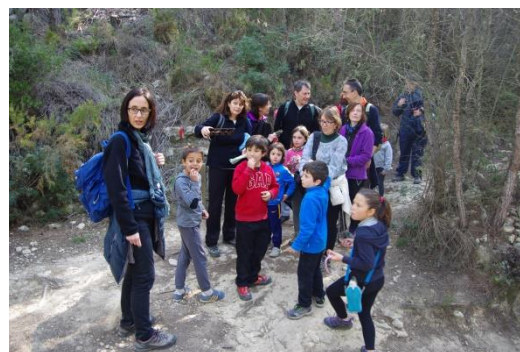
Imatges de la sortida a Penyafort dels passat 13 de març.