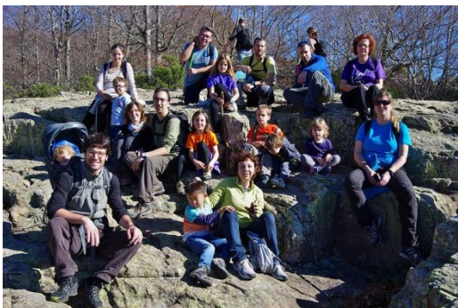
Participants de la sortida del mes de novembre al Montseny.

19 desembre Pessebre a Sant Antoni (dissabte tarda amb frontals i lots)